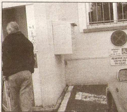
◆ À la Maison sociale, rue Gautherin, la place de stationnement est proche et l'ascenseur fonctionne bien.

La Maison sociale (ex CCAS), rue Gautherin est accessible aussi et l'ascenseur fonctionne bien. Un peu plus loin, la médiathèque Florian est accessible également à l'extérieur comme