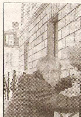
◆ La mairie est bien adaptée pour les personnes en fauteuil, mais actuellement trop forte.